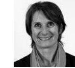
Vice-Présidente Béatrice LEJEUNE Communauté d'Agglomération du Beauvaisis