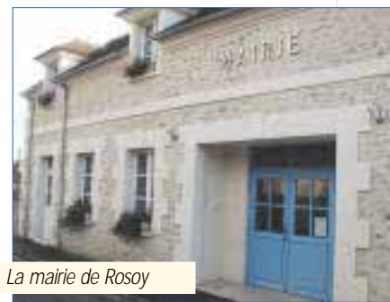
La mairie de Rosoy

Des procédures administratives longues mais nécessaires pour mettre en œuvre une volonté commune de coopération intercommunale pour des compétences d'intérêt communautaire.