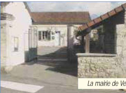
La mairie de Verderonne

Des procédures administratives longues mais nécessaires pour mettre en œuvre une volonté commune de coopération intercommunale pour des compétences d'intérêt communautaire.