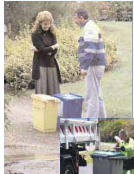
La dotation sur les deux nouvelles communes